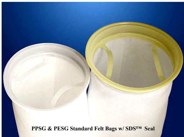
PPSG & PESG Standard Felt Bags w/ SDS™ Seal